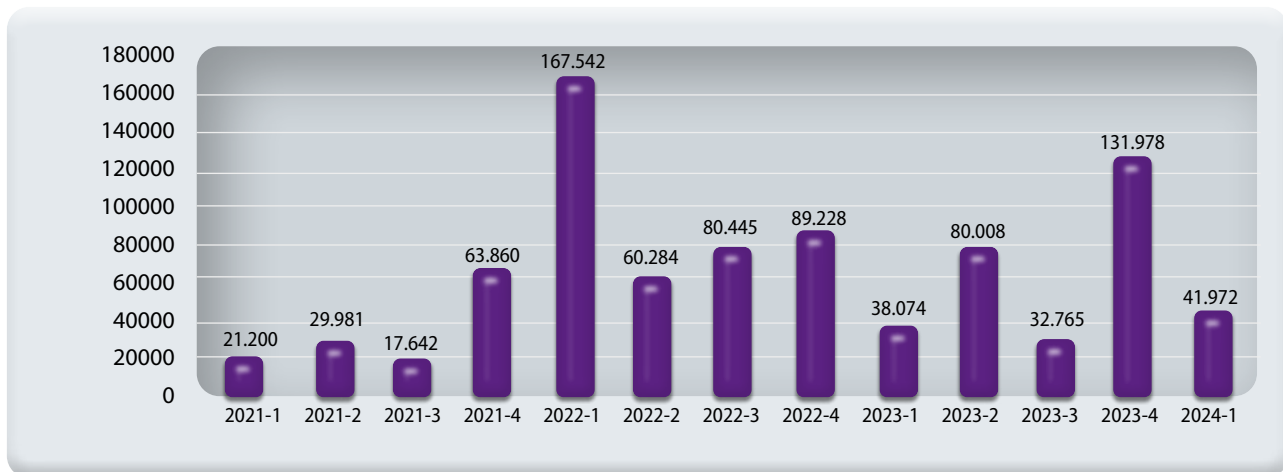
Figura 1. Área culminada con destinación para hospitales y centros asistenciales (total metros cuadrados)